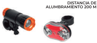
DISTANCIA DE ALUMBRAMIENTO 200 M

Soportan salpicaduras de agua. Haz de luz ajustable. Linterna delantera: LED CREEMR: 50% Más eficiencia que un led de alta potencia, Tecnología KLINLITE, lente convexo con lupa que brinda un haz de luz limpio y 3 Niveles de iluminación/ modos de luz: alto, bajo e intermitente. Linterna trasera: Modos de iluminación: Luz roja fija y 6 diferentes destellos de luz.