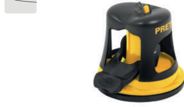
PARA CUCHILLOS DE HOJA LISA

Cuerpo de ABS. Muelas de carburo de tungsteno. Base con ventosa para fijar. No afila cuchillos de sierra.