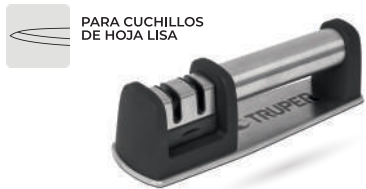
PARA CUCHILLOS DE HOJA LISA

Cuerpo de acero inoxidable con soportes de ABS y base antideslizante, 2 niveles de afilado. Afilado grueso: Hojas de carburo de tungsteno, ideal para cuchillos con filo completamente desgastado. Afilado fino: Hojas cerámicas, ideal para perfilado y pulido de cuchillos.